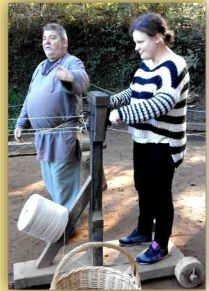
La fabrication de cordes

Aabraysie Développement a organisé une sortie d'équipe pour ses salariés des espaces verts (ACI 1 , SID 2 et SAP 3 ), ses salariés permanents et les membres du Conseil d'Administration, Mardi 27 Septembre au chantier médiéval de Guédelon , dans l'Yonne, site en construction depuis presque 20 ans, selon les techniques du XIIIème siècle. Ensemble, les collègues d'Aabraysie ont découvert le château, le moulin, les techniques de construction du Moyen-Âge, et surtout discuté avec les différents artisans dans la joie et la bonne humeur. Par un temps idéal, notre guide nous a fait cheminer autour du château et dans ses différentes pièces, commentant de manière captivante ce projet que tout le monde a apprécié. Merci Aabraysie !