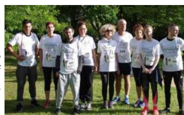
▲ Equipe mixte Aabraysie Développement , Médiation et Maison intergénérationnelle Mosaïque .