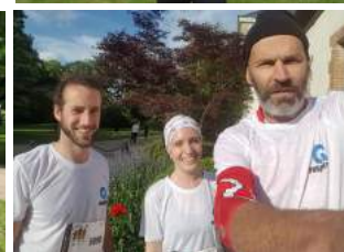
▲ Equipe Respire