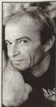
BAR ROCK. Il avait tenu l'Infrared pendant deux ans.