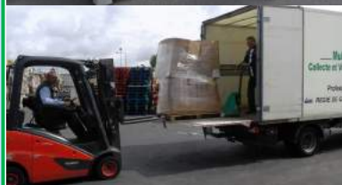
▲ Chargement du textile.