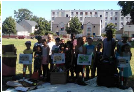
Suite au ramassage des déchets avec Respire, les enfants ont participé à l'atelier ludique de tri des déchets avec Orléans Métropole.