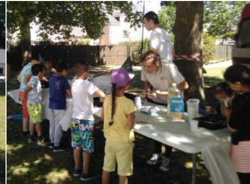
Atelier fabrication de pâte à modeler avec du marc de café, par les Compagnons Bâisseurs