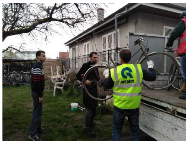
Livraison des vélos à 1-Terre-actions par Respire après collecte auprès du local de réemploi à Saran