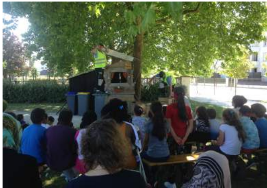
Spectacle de théâtre