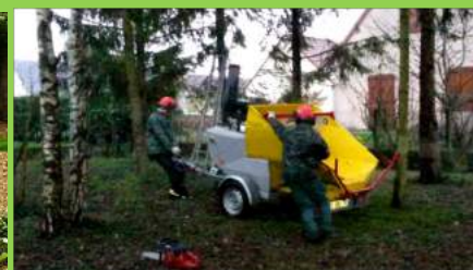
Broyage de végétaux par Respire