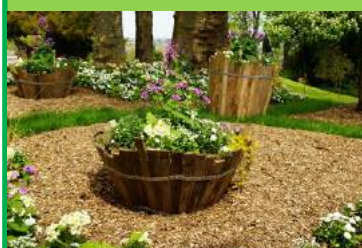
Exemple de paillage

Ces techniques sont des alternatives aux engrais chimiques et aux pesticides. Elle sont naturelles, gratuites et sécurisantes.